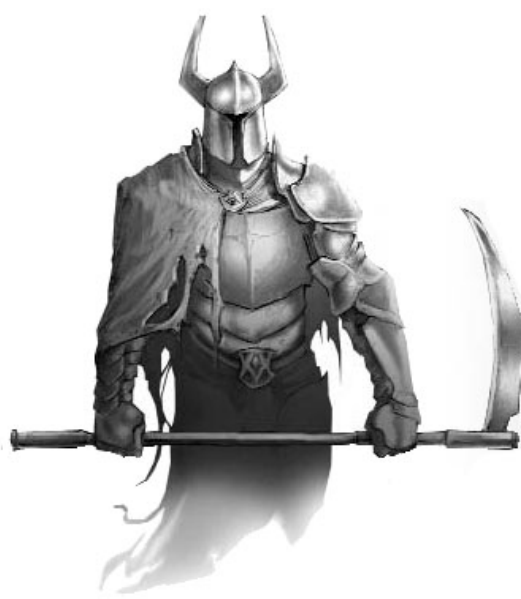
Seigneur la Mort